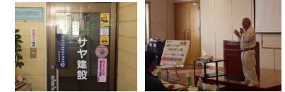
防犯ステッカーの貼付